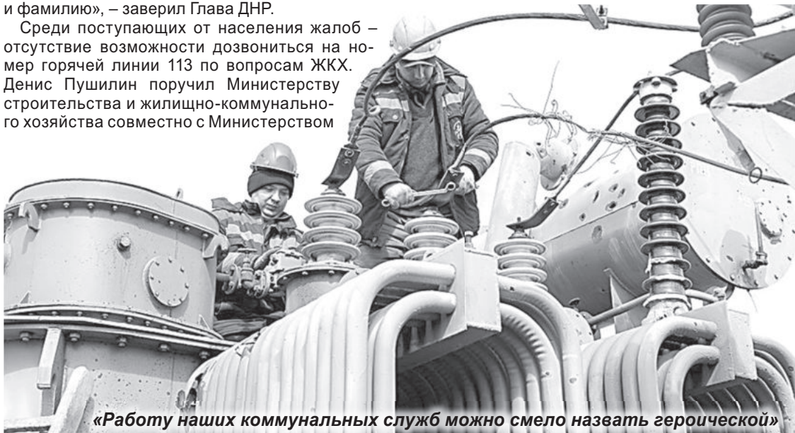
«Работу наших коммунальных служб можно смело назвать героической»

В октябре этого года Денис Пушилин дал поручение Министерству транспорта активизировать работу по контролю за санитарно-техническим состоянием общественного транспорта и соблюдением перевозчиками графиков движения. «Проверки дали положительный результат. Жители активно включились в процесс выявления фактов неудовлетворительного состояния общественного транспорта, а также соблюдения расписания. Тем не менее остаются маршруты, по которым много вопросов. Поручил Министерству транспорта совместно с муниципалитетами откорректировать графики тех маршрутов муниципального транспорта, на которые идут жалобы. С учетом поступления нового подвижного состава, прибытие которого мы ожидаем в Республику в ближайшее время, поручил отработать совместно с муниципалитетами вопросы распределения транспорта согласно потребности», – рассказал Глава ДНР.