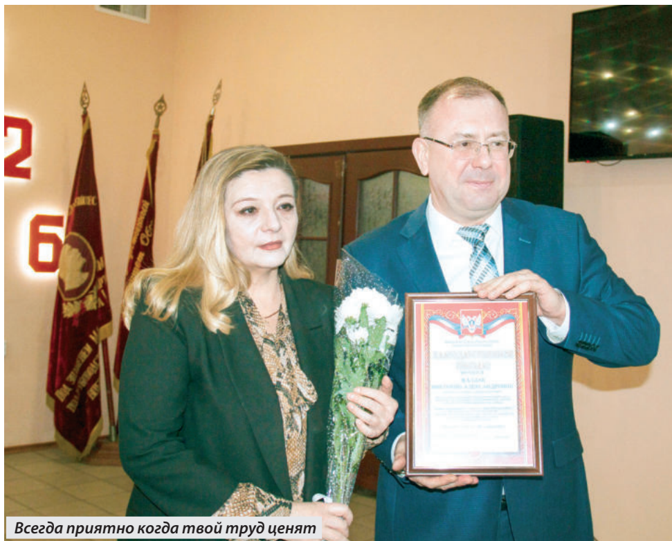
Всегда приятно когда твой труд ценят

СВОЙ 126 ДЕНЬ РОЖДЕНИЯ ОТМЕТИЛ ЕНАКИЕВСКИЙ МЕТАЛЛУРГИЧЕСКИЙ ЗАВОД