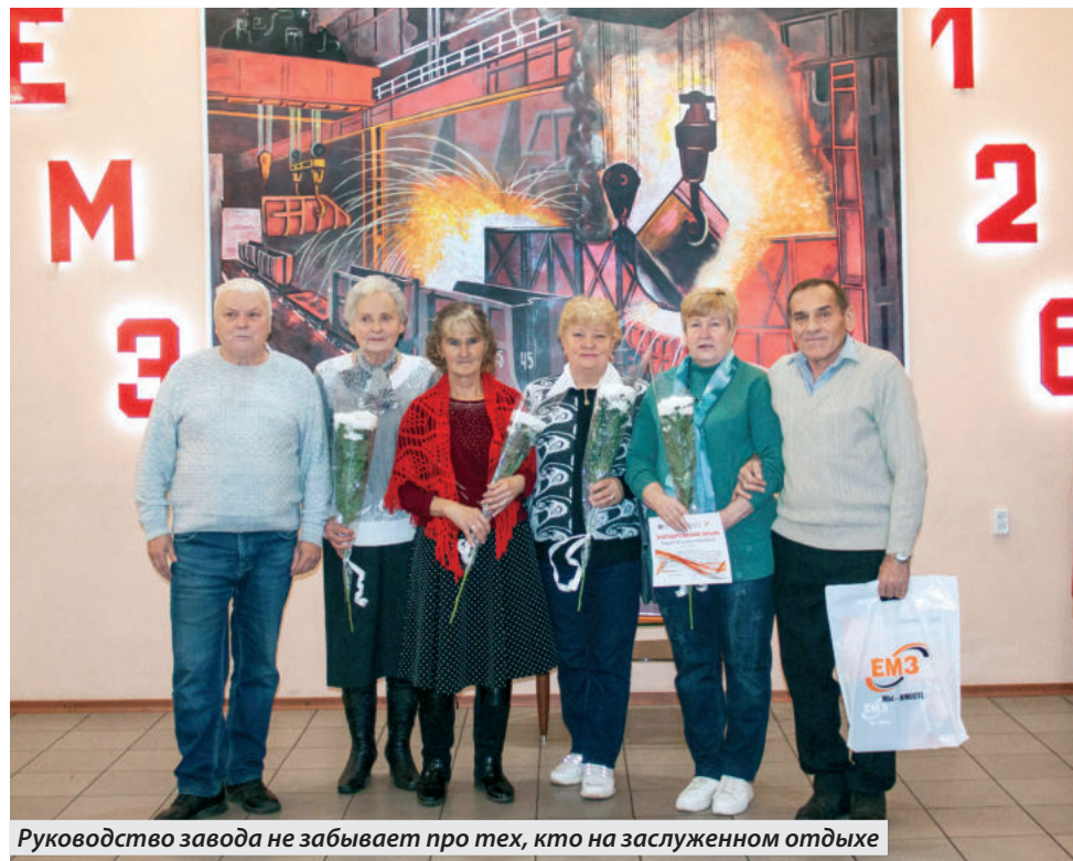
Руководство завода не забывает про тех, кто на заслуженном отдыхе