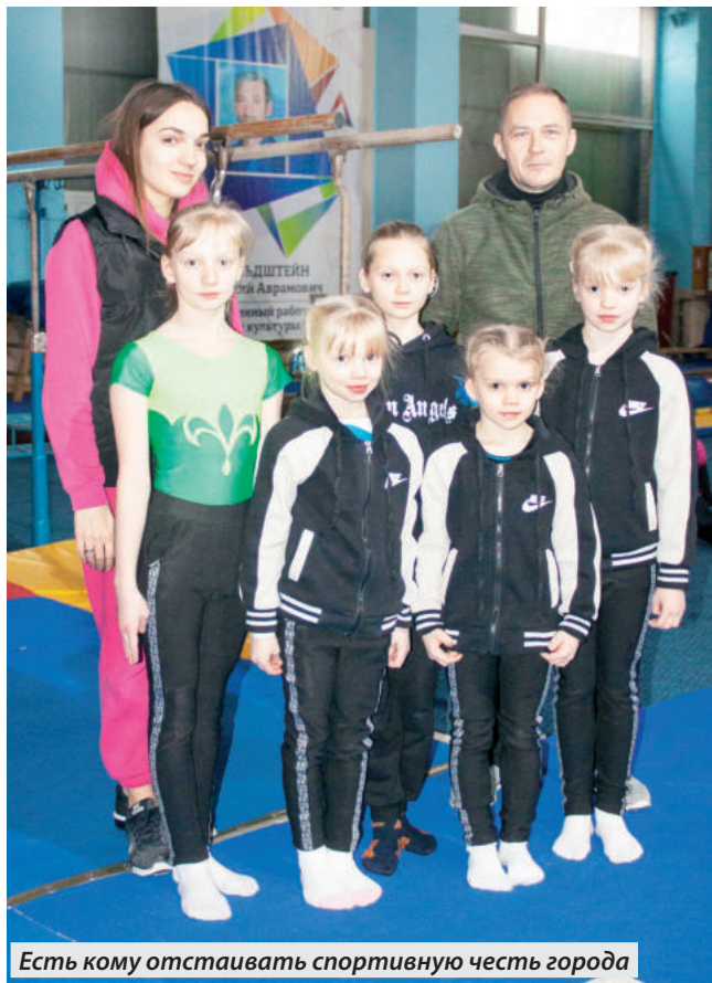
Есть кому отстаивать спортивную честь города

ЕНАКИЕВСКАЯ СЕКЦИЯ СПОРТИВНОЙ ГИМНАСТИКИ ГОТОВИТСЯ К НОВЫМ ПОБЕДАМ