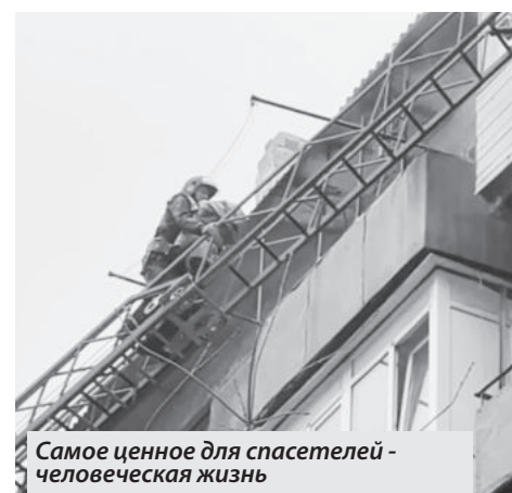
Самое ценное для спасателей - человеческая жизнь

9 декабря выдалось жарким для пожарных г. Енакиево. На пульт дежурного экстренной службы поступил сигнал. Звонивший на короткий номер 101 сообщил, что в доме по ул. Блюхера произошло возгорание. Время сообщения - 15 ч. 43 мин.