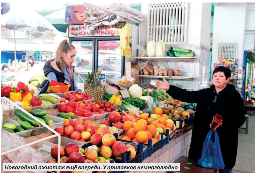
Новогодний ажиотаж ещё впереди. У прилавков немногочисленно

Мы затягиваем ремни, пенсионеры горестно вздыхают у прилавков. А совсем скоро Новый год. И хотелось бы на праздничный