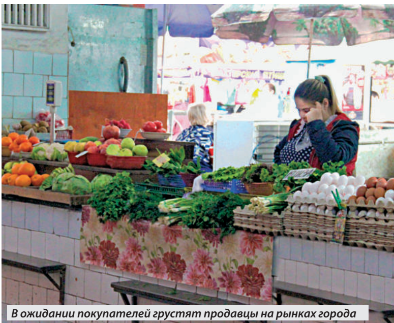
В ожидании покупателей грустят продавцы на рынках города