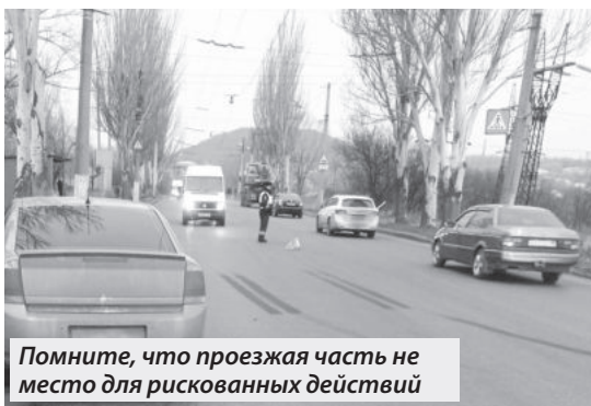
Помните, что проезжая часть не место для рискованных действий

ГОСАВТОИНСПЕКЦИЯ ОБРАЩАЕТСЯ К ПЕШЕХОДАМ С ПРИЗЫВОМ НЕУКОСНИТЕЛЬНО СОБЛЮДАТЬ ПРАВИЛА ДОРОЖНОГО ДВИЖЕНИЯ