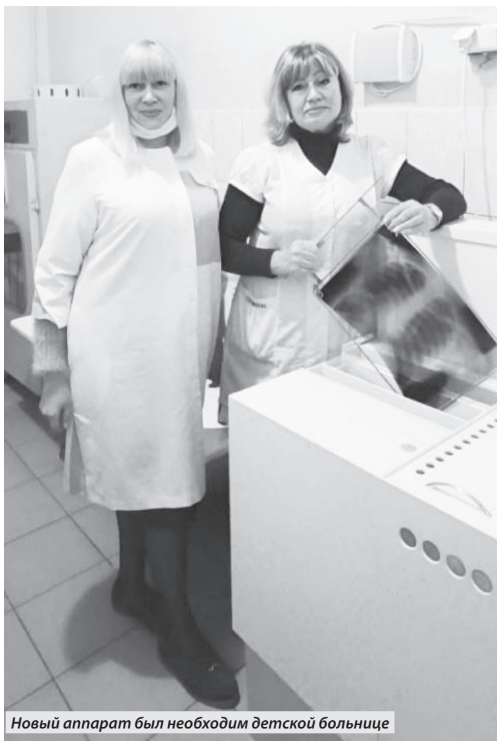
Новый аппарат был необходим детской больнице

И еще один важный аспект: благодаря приобретенному современному оборудованию сократится время проявки снимков, и, как следствие, пациенты будут тратить меньше времени на ожидание» – отметила вице-премьер.