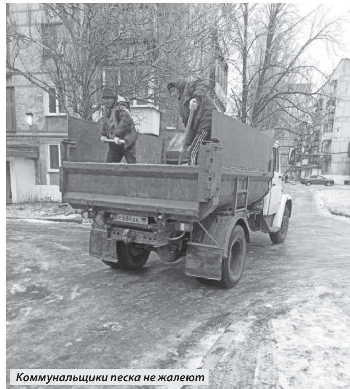
Коммунальщики песка не жалеют