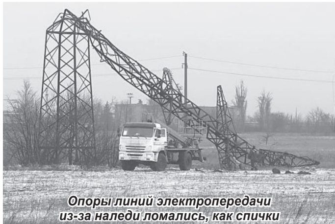
Опоры линий электропередачи из-за наледи ломались, как спички

«Хороший результат», – подытожил Денис Пушилин и добавил, что важно сообщить о дальнейших планах восстановления, «чтобы люди понимали, когда будет делаться следующая дорога».