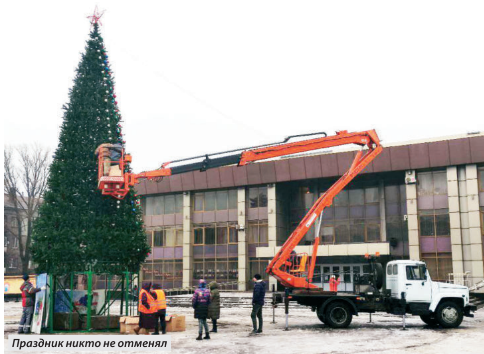
Праздник никто не отменял