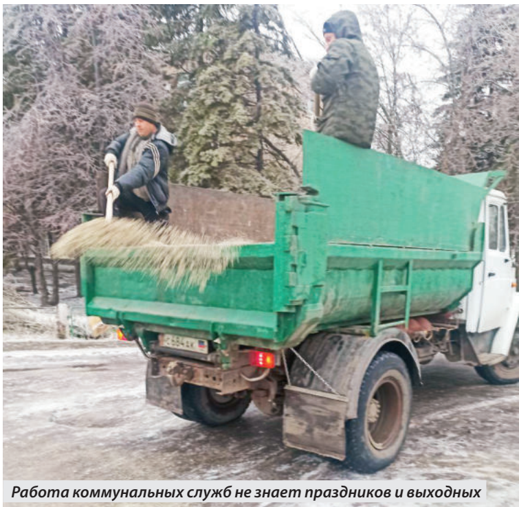
Работа коммунальных служб не знает праздников и выходных

ДАЛ СЛОВО – СДЕРЖИ! ВЗЯЛ ОБЯЗАТЕЛЬСТВО – ВЫПОЛНИ! ЭТО ЛОЗУНГ ИЗ СОВЕТСКИХ ВРЕМЕНИ, НО ДЛЯ ГОРОДСКИХ ЧИНОВНИКОВ АКТУАЛЕН И СЕГОДНЯ