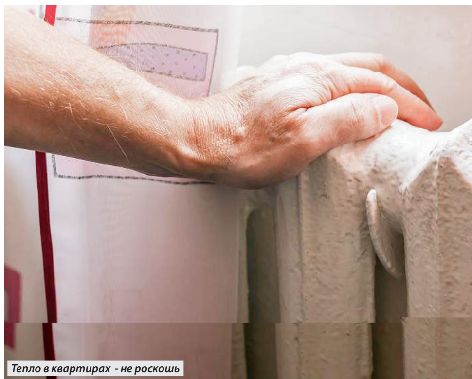
Тепло в квартирах - не роскошь

«Завоздушность» внутридомовых сетей, порывы в квартирах и подвалах внутридомовых сетей, изношенность