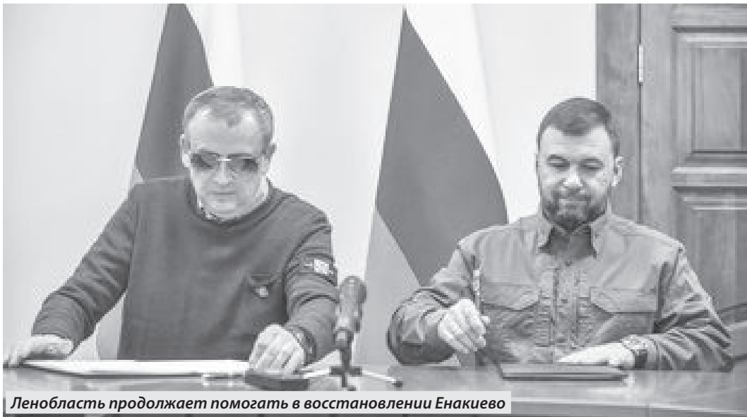
Ленобласть продолжает помогать в восстановлении Енакиево

ЛЕНИНГРАДСКАЯ ОБЛАСТЬ ПРОДОЛЖАЕТ ПОМОГАТЬ ЕНАКИЕВО