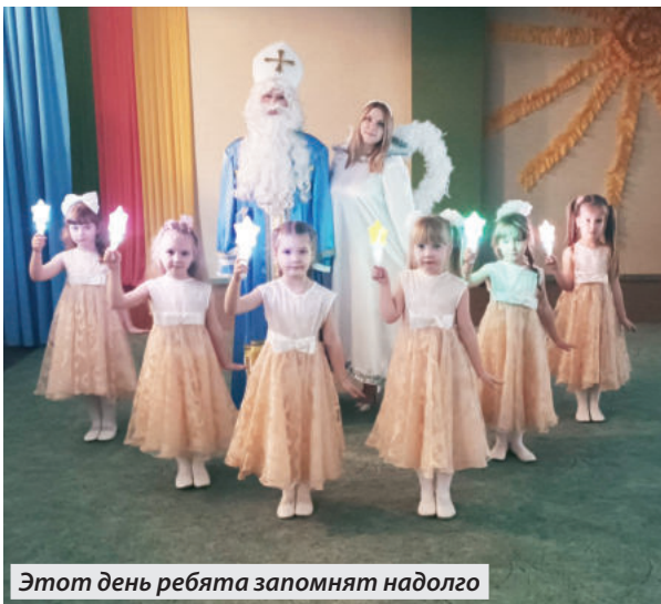
Этот день ребята запомнят надолго

И пока живы семейные ценности, можно не переживать за будущее нашей страны. Ведь