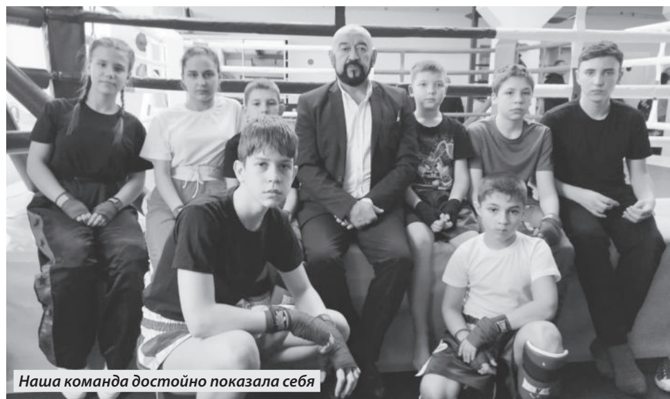
Наша команда достойно показала себя