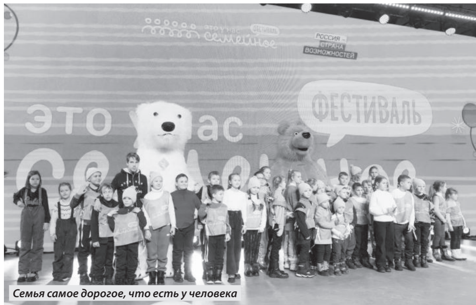
Семья самое дорогое, что есть у человека

66 семей из Донецкой и Луганской Народных Республик, Запорожской и Херсонской областей областей приехали в столицу России, чтобы принять участие в фестивале «Это у нас семейное».