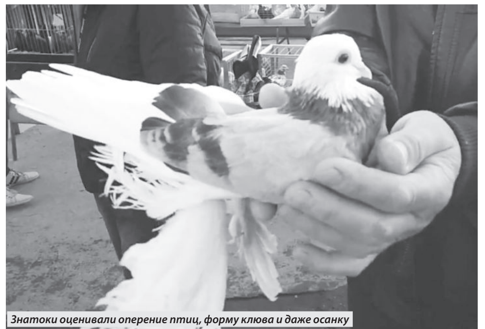
Знатки оценивали оперение птиц, форму клюва и даже осанку

Поколение 50-х помнит, как мальчишками гоняли голубей, как помогали голубеводам ухаживать за птицами. Поколение 70-х помнит детские фильмы, практически в каждом из которых сцена на голубятне была одной из захватывающих дух. Ну а как же? Голуби – это небо, а значит, романтика, свист ветра в крыльях и бесконечный полет к мечте... К миру. Поколение next видит в голубях, увы, только до боли знакомого обитателя городских «джунглей», вечно спящего под ногами. Таковы реалии времени. Суета и полное отсутствие романтики. Где уж в этом шуме разобрать тихие птичьи голоса, где найти окошко в расписании бегущего на длинную дистанцию общества, чтобы понаблюдать за настоящим, за природой.