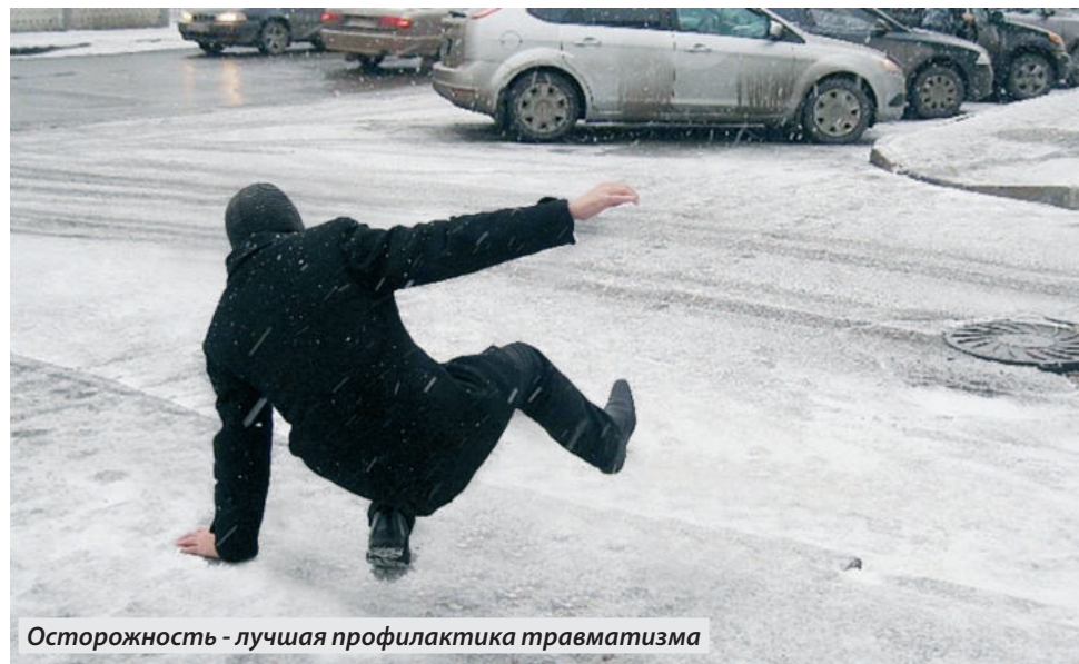
Осторожность - лучшая профилактика травматизма

В связи с аномальными погодными условиями в регионе город Енакиеве уже больше недели страдает от гололеда, который создает серьезные проблемы.